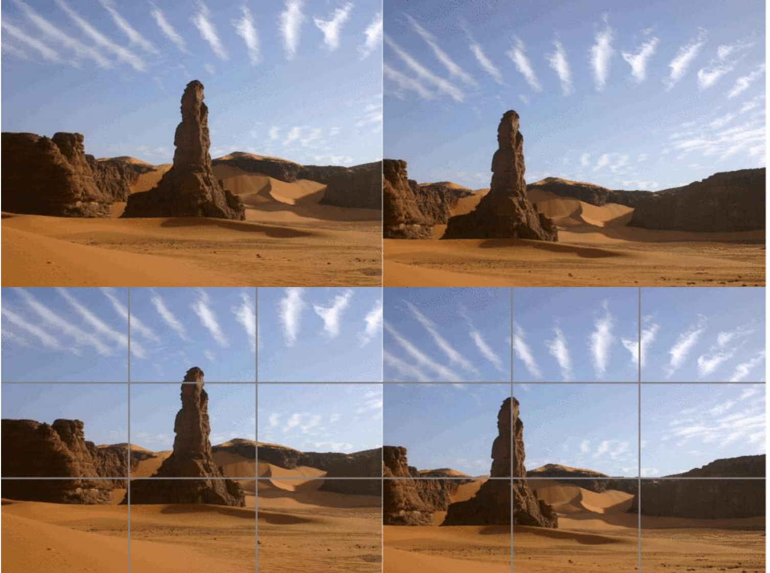
تفاوت دو تصویر از یک منظر با توجه به قانون یک سوم

در یک تصویر نقاط از نظر جلب توجه کردن یکسان نیستند. نقاطی که در اولین نگاه مورد توجه قرار می‌گیرند را نقاط طلایی می‌گویند. تجربه نشان می‌دهد که این نقاط در محل تقاطع خطوطی قرار دارند که طول و عرض تصویر را به سه قسمت مساوی تقسیم می‌کنند. به همین دلیل به آن قانون یک سوم گفته می‌شود.